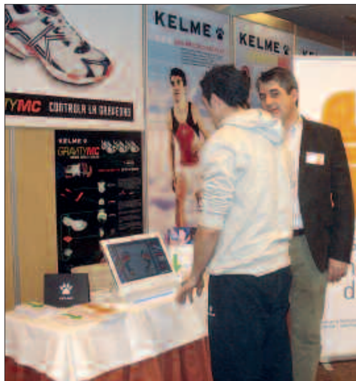
Momento del análisis de la pisada a cargo del Instituto Valenciano del Pie.

A través de la tecnología más innovadora, El Instituto Valenciano del Pie garantiza la personalización de cada paciente, elaborando plantillas adaptadas a las características particulares de cada pie. El 40% de los atletas que pasaron por el stand necesitaban plantillas y zapatillas personalizadas.