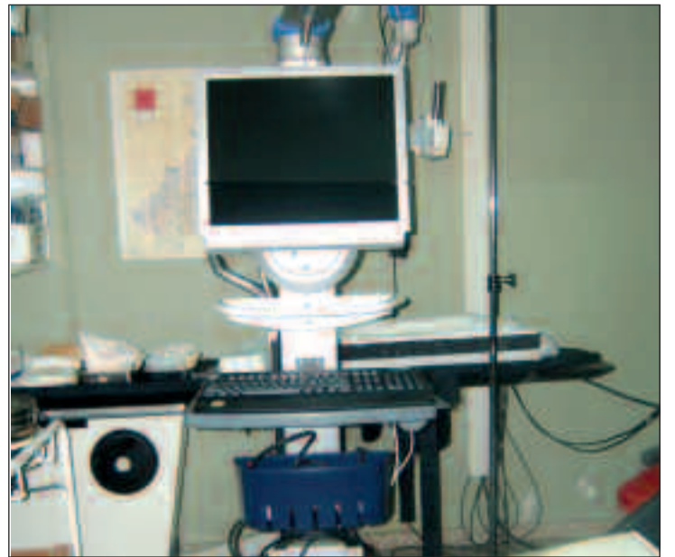
La tecnología para combatir el cáncer de mama ya funciona en el Provincial de Castellón.

De esta forma se puede evitar el vaciamiento global. Mediante este equipamiento, aparte de detectar la radiactividad, posee una cámara que ofrece en tiempo real la imagen intraoperatoria, no solo la morfológica, sino también la funcional, permitiendo obtener registros en cualquier momento del acto quirúrgico.