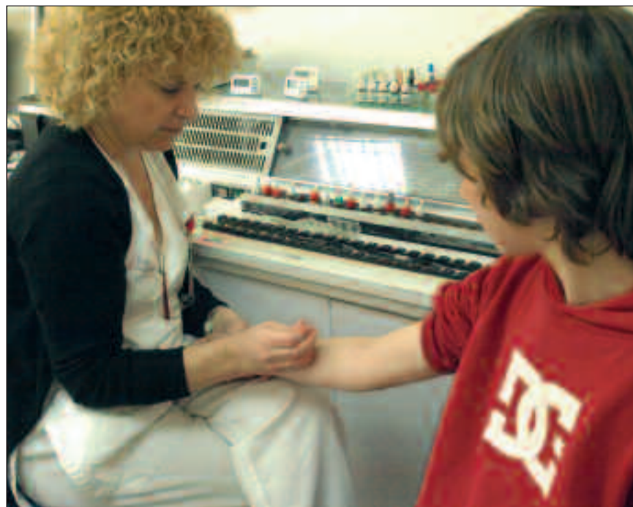
Una enfermera extrae una muestra de sangre a un niño en un hospital de la Comunitat.

ca ha puesto manos a la obra con medidas específicas, entre las que el conseller puso de relieve el pago de la productividad. Así, según el acuerdo de 2010, se abonarán incentivos al personal sanitario, ya que constituyen un requisito obligatorio para que los profesionales se promocionen en el sistema de la carrera profesional. De esta manera, desde el pasado febrero y a lo largo del actual mes de marzo, las direcciones de cada centro están proponiendo los objetivos a cada una de las unidades en la que se integran los más de 65.000 trabajadores de la Agencia Valenciana de Salud para posibilitar que, cuando finalice el primer trimestre del año, todos ellos hayan recibido y firmado las metas establecidas de cara a 2010.