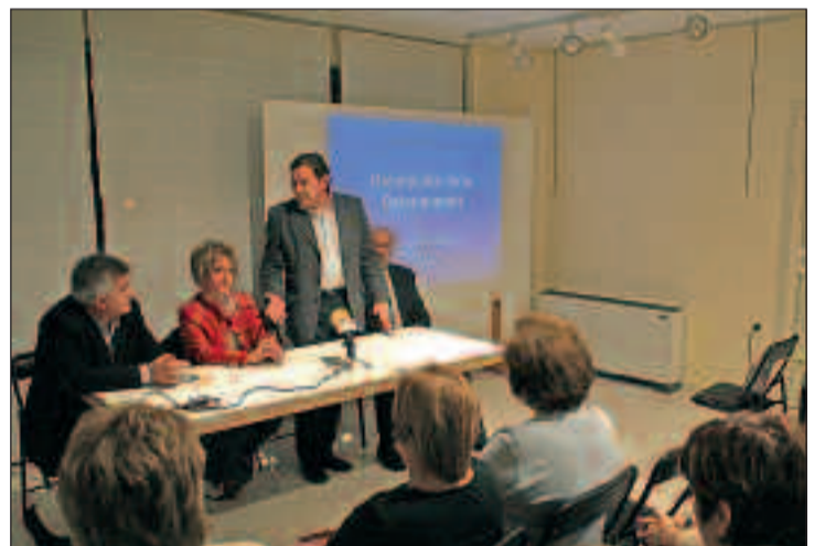
Sesión informativa sobre la prevención de la osteoporosis, celebrada en la Comunitat.

La osteoporosis es una enfermedad silenciosa que, como tal, no proporciona ningún síntoma. Su consecuencia natural, la fractura osteoporótica, es el verdadero problema de salud que ocasiona esta patología, generando altas cuotas de morbilidad y mortalidad con grandes repercusiones sanitarias, sociales y económicas. De he-