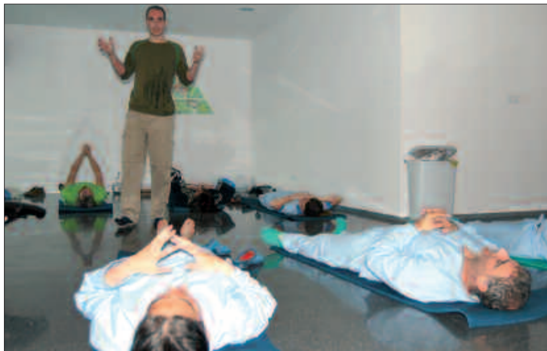
Momento de una de las sesiones de relajación efectuadas en el Hospital de Dénia para enfermos mentales.