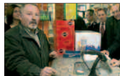
Un usuario utiliza la receta electrónica en Alicante.

Desde finales de marzo de 2008, la administración sanitaria está extendiendo la disponibilidad de la receta electrónica de forma progresiva en la Comunitat, y ya está presente en las 299 oficinas de farmacia de la provincia de Castellón, con la cobertura total de su población (578.549 personas), y en 22 farmacias de la provincia de Valen-