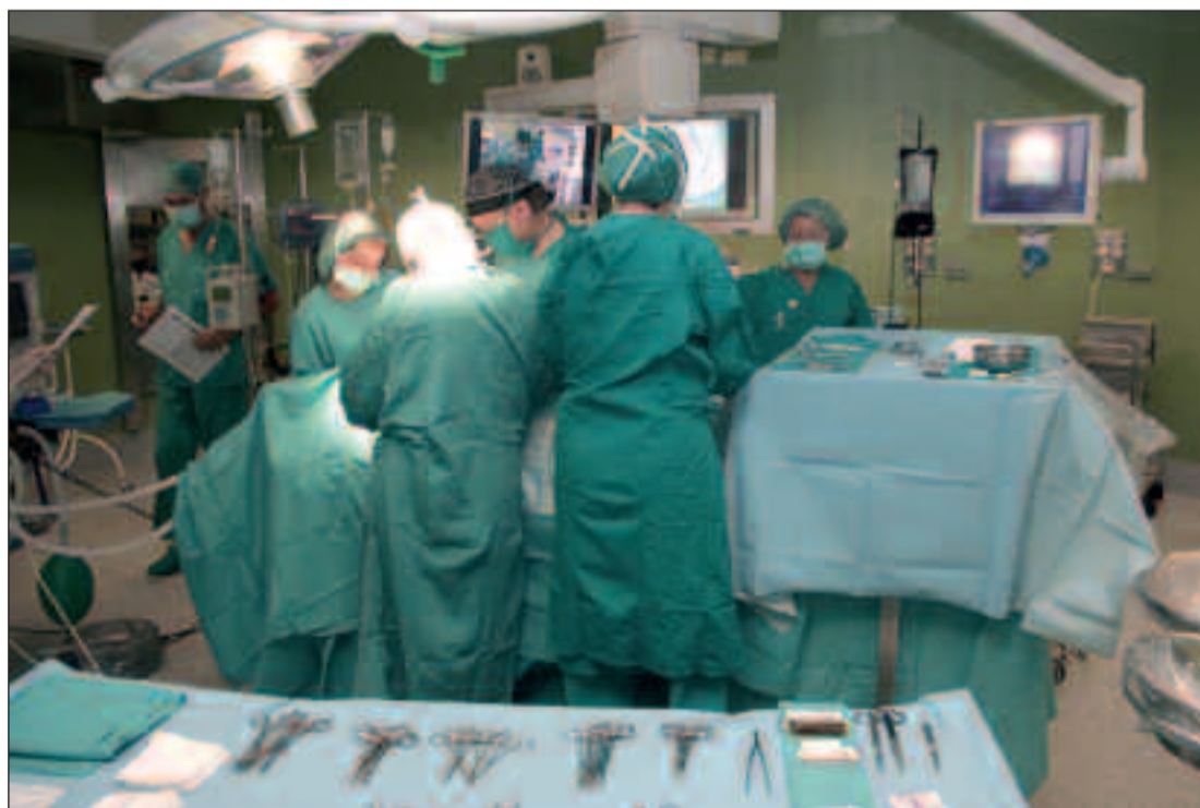
Imagen de una operación quirúrgica en un centro hospitalario de Valencia.

En cualquier caso, y a pesar del borrascoso contexto en que se mueven tanto la sanidad como la economía en España, la red asistencial de la Comunitat sigue sacando adelante sus propias metas de eficiencia. Una prueba fidedigna de ello es que los hospitales públicos del territorio autonómico llevaron a cabo un total de 317.947 intervenciones quirúrgicas en 2009 (171.002 en Valencia, 113.356 en Alicante, y 33.589 en Castellón) El 84,2 por ciento de estas intervenciones fueron programadas y el 15,8 por ciento revistieron carácter de urgencia. Así, las operaciones de cirugía mayor con ingreso ascendieron a 139.254, mientras que se contabilizaron 95.868 intervenciones de cirugía mayor ambulatoria y otras 82.825 de cirugía menor.