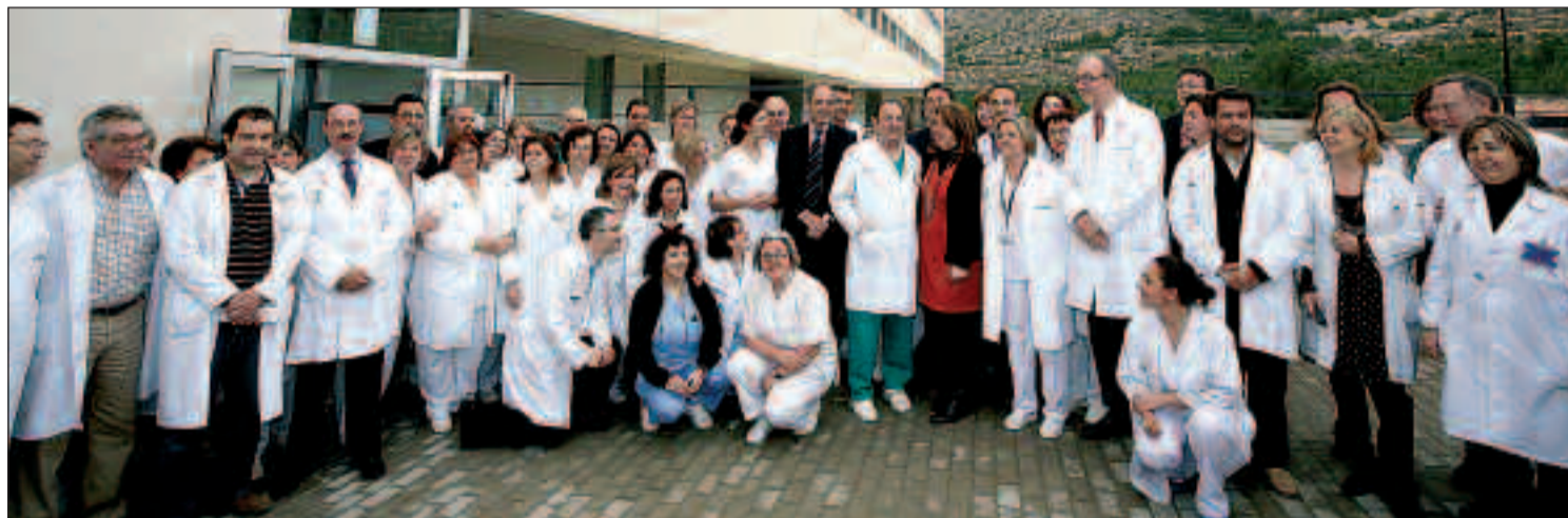
En el centro de la imagen, el presidente de la Generalitat, Francisco Camps, durante su reciente visita al Hospital de Elda.

El presidente de la Generalitat, Francisco Camps, presidió el acto de inauguración de la ampliación del Hospital de Elda, que ha supuesto una inversión, por parte del Consell, de treinta millones de euros, y la contratación de 196 nuevos profesionales. De esta manera, el hospital se ha convertido en un centro médico de referencia comarcal provincial.