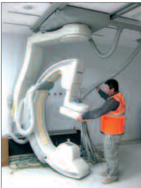
El montaje de los aparatos es de una alta complejidad y requiere de un proceso laborioso.

El Hospital del Vinalopó ha apostado por tecnología Philips, empresa líder mundial en Bienes-