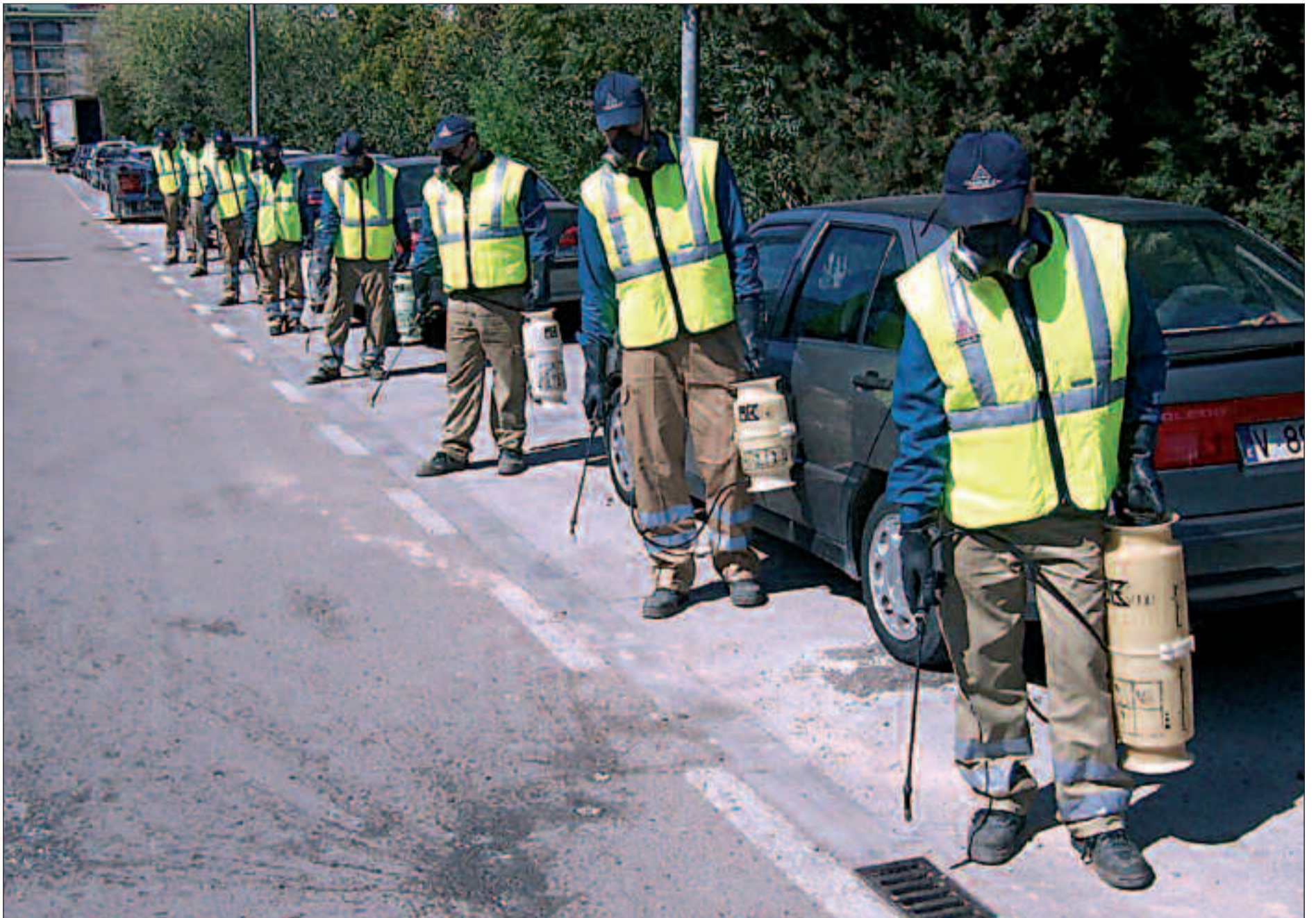
Un equipo de desodorización aplica productos bactericidas en la ciudad de Valencia para mejorar el ambiente.