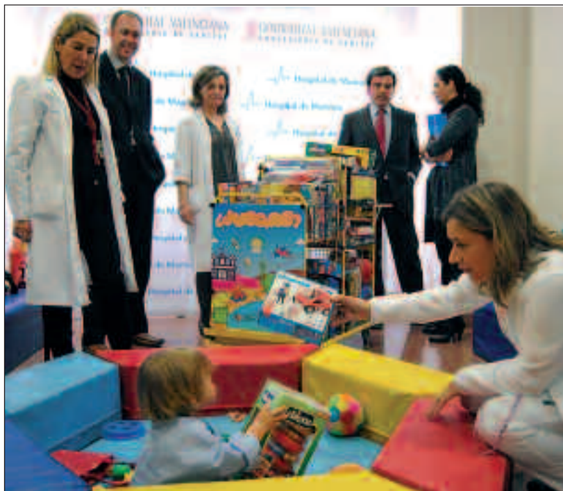
Momento de la inauguración de la ludoteca del Hospital de Manises.

El Hospital de Manises ha incorporado una ludoteca móvil con 90 juguetes infantiles que se ha instalado en el área de pediatría del centro hospitalario con el objetivo de mejorar la calidad de vida y la salud de los niños hospitalizados. La compañía Pfizer en colaboración con la Agencia Valenciana de Salud ha entregado en el Hospital de Manises una “Ludomóvil. Manises se suma así a los 19 hospitales de la Comunitat participantes en la campaña ‘¿Juegas?’ que tiene por objetivo mejorar la calidad de vida y la salud de los niños hospitalizados. Así, este soporte está específicamente diseñado para fomentar el juego de los niños desde la propia habitación, ya que permite depo-