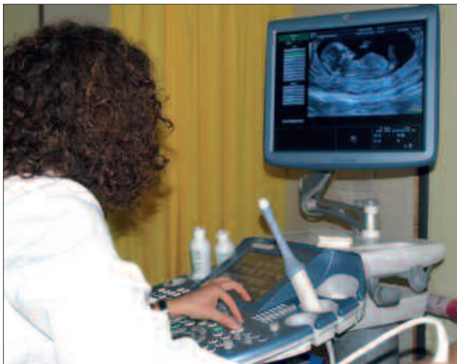
Una especialista comprueba los resultados de una ecografía.