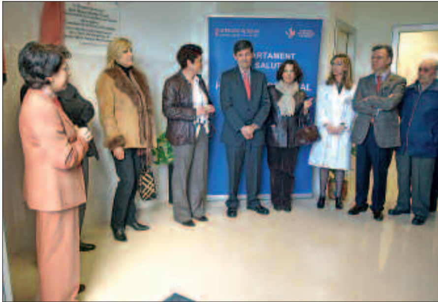
Momento en que las autoridades asisten a la inauguración del consultorio auxiliar en La Torre d'en Doménec.

obras e instalaciones para adecuarlo. Para atender a los 191 pacientes que tienen asignado este consultorio auxiliar, un médico y una enfermera pasarán visita lunes, miércoles y viernes, y de lunes a viernes, respectivamente