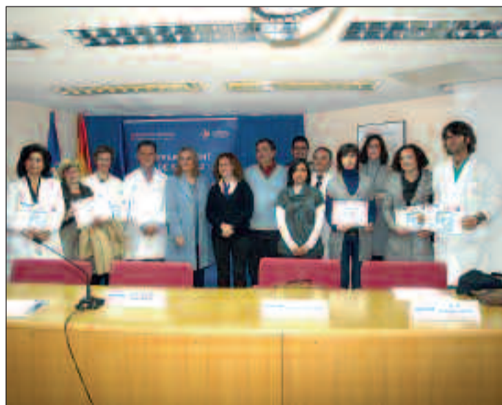
Momento de la entrega del diploma en lengua de signos.