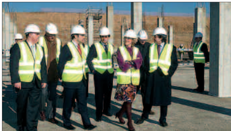
Momento de la visita por las obras de construcción del futuro hospital público de Torrejón de Ardoz, en Madrid.

novación, sostenibilidad y confort, con la utilización de energías renovables con arquitectura bioclimática. Contará con habitaciones individuales, 10 quirófanos, 6 partitorios, una amplia cartera de especialidades y una tecnología puntera con historia clínica electrónica y radiología digital, de forma que los profesionales compartirán en tiempo real la historia de sus pacientes y podrán solicitar desde cualquier punto pruebas diagnósticas visualizando de inmediato los resultados.