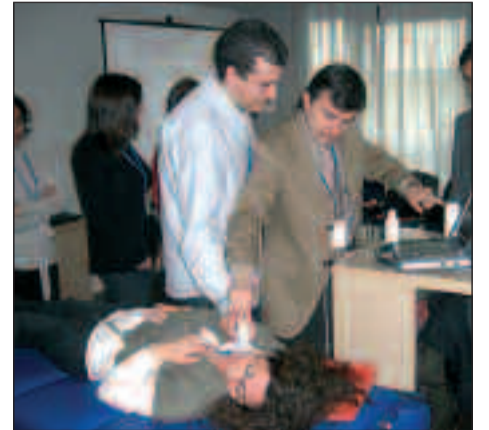
Exposición de un ejercicio de recuperación cardiovascular.