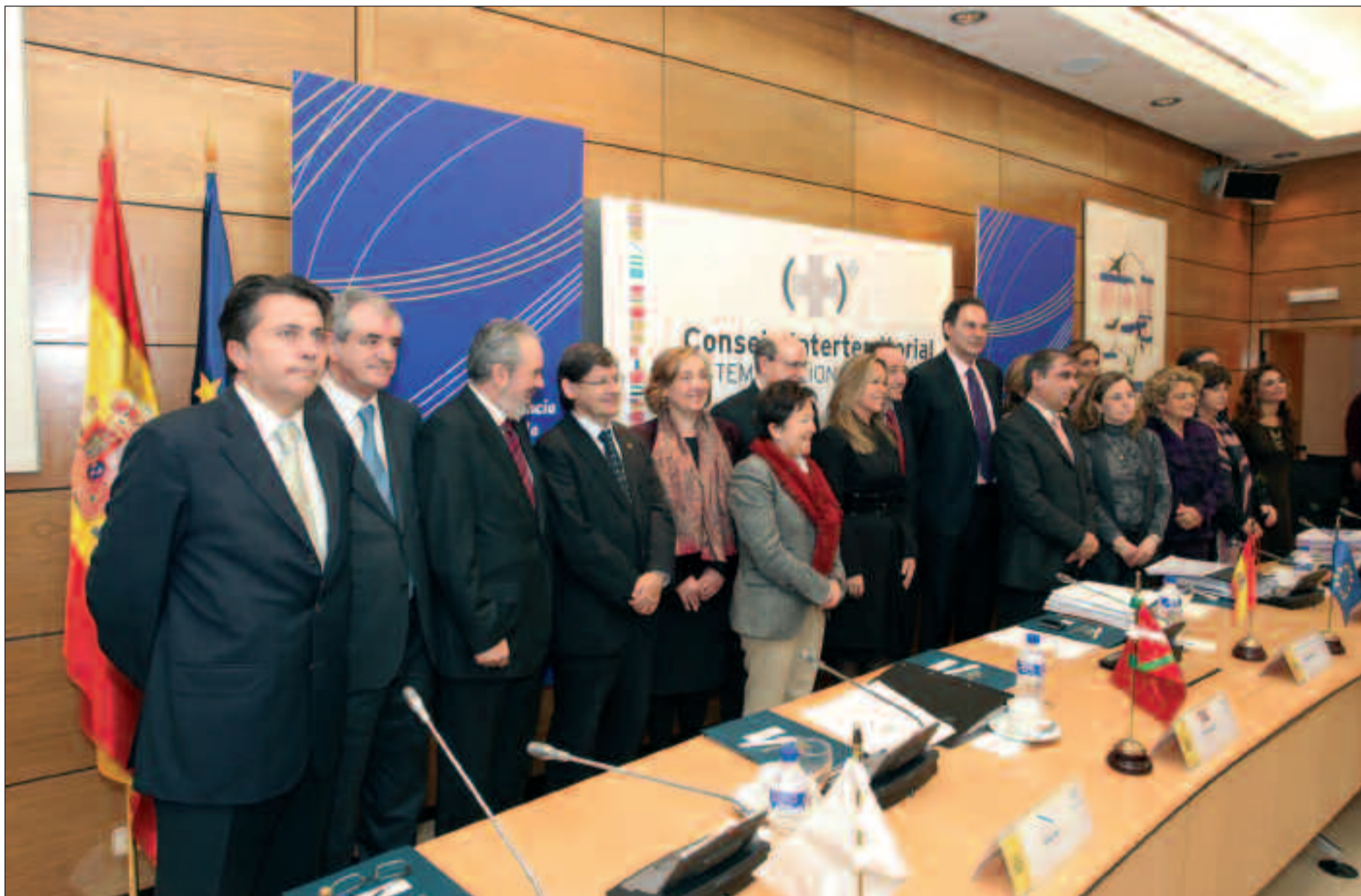
Imagen de la última reunión del Consejo Interterritorial de Sanidad, celebrado en Madrid bajo la presidencia de la ministra Trinidad Jiménez.